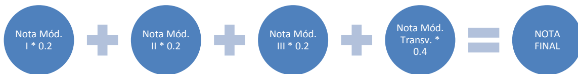
Figura de Calificación del Programa de Diplomado

c) La calificación que acreditará el certificado y diploma estará expresado según la siguiente escala: