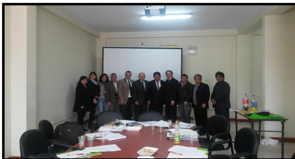
Todos los actores público y privado de Lima Sur, en el distrito de Lurín