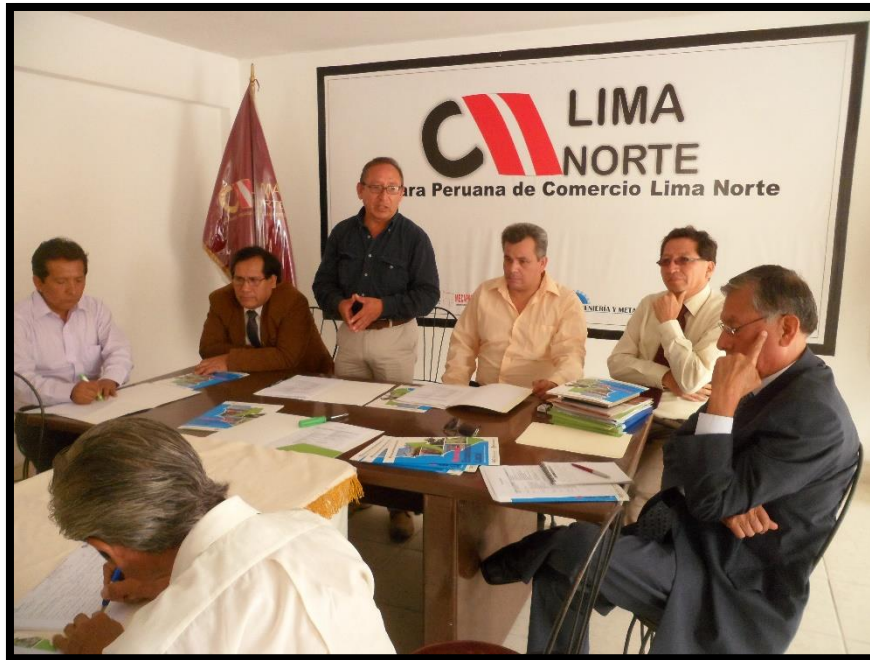
Reunión del Pleno del CODET AILN en la Camara Peruana de Comercio de Lima Norte