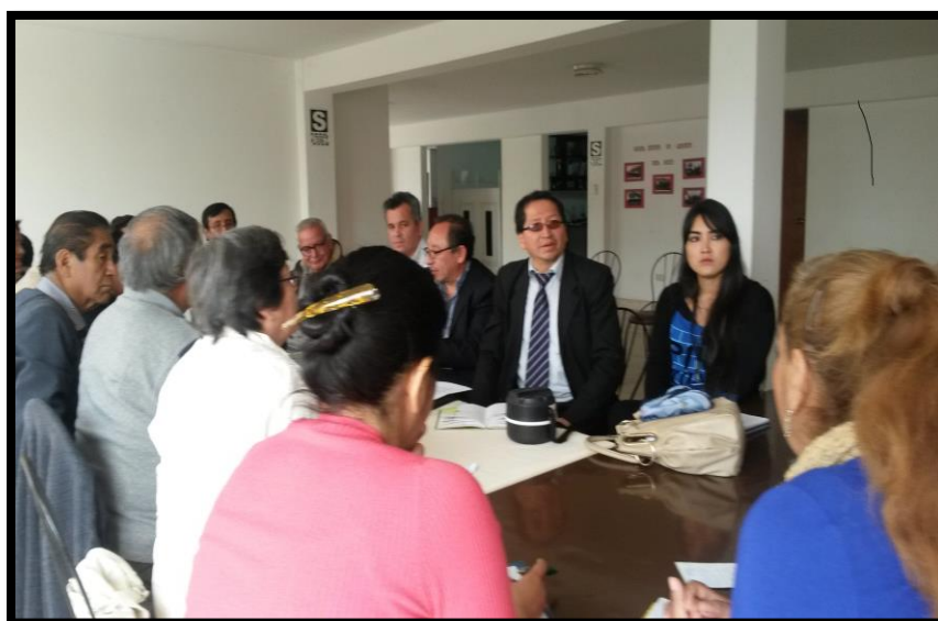
Reunión del Pleno del CODET - AILN

El día 05 de diciembre de 2014 se realiza el II ENCUENTRO POR EL DESARROLLO ECONÓMICO TERRITORIAL DE LIMA NORTE y el I ANIVERSARIO DEL CONSEJO DE DESARROLLO ECONÓMICO TERRITORIAL de LIMA NORTE en el Estadio Ricardo Palma de la Municipalidad distrital de Carabaylo.