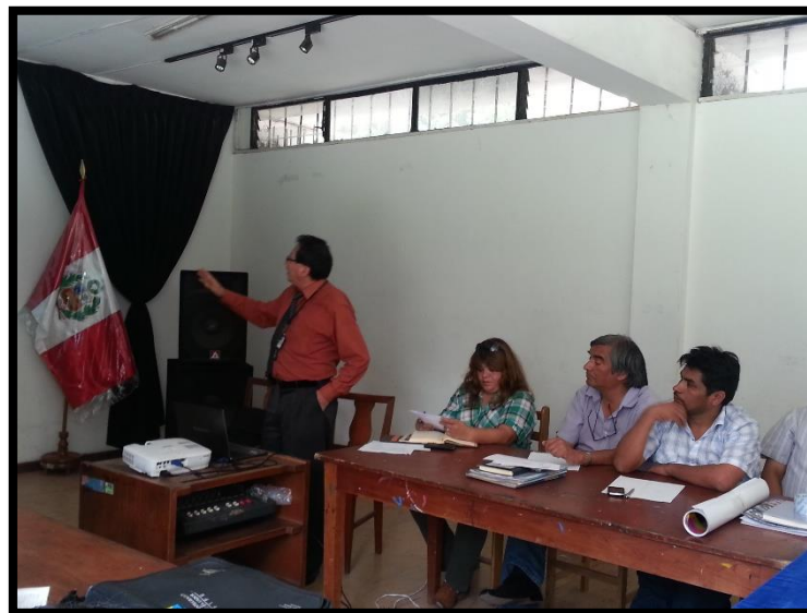
Reunión en el distrito de Chaclacayo.

El día 08 de febrero de 2014 se realizó el Lanzamiento del Consejo de Desarrollo Económico Territorial del Área Interdistrital de Lima Este en la Municipalidad distrital de Ate, luego de las reuniones sostenidas con los actores públicos y privados, se crean 05 Comisiones Permanentes: 1) Comisión Permanente de Gestión y Planificación Interdistrital, 2) Comisión Permanente de Desarrollo Económico Local, 3) Comisión Permanente de Formalización y Organización del Comercio, 4) Comisión Permanente de Fomento del Comercio y las Exportaciones 5) Comisión Permanente Técnica y Universitaria.