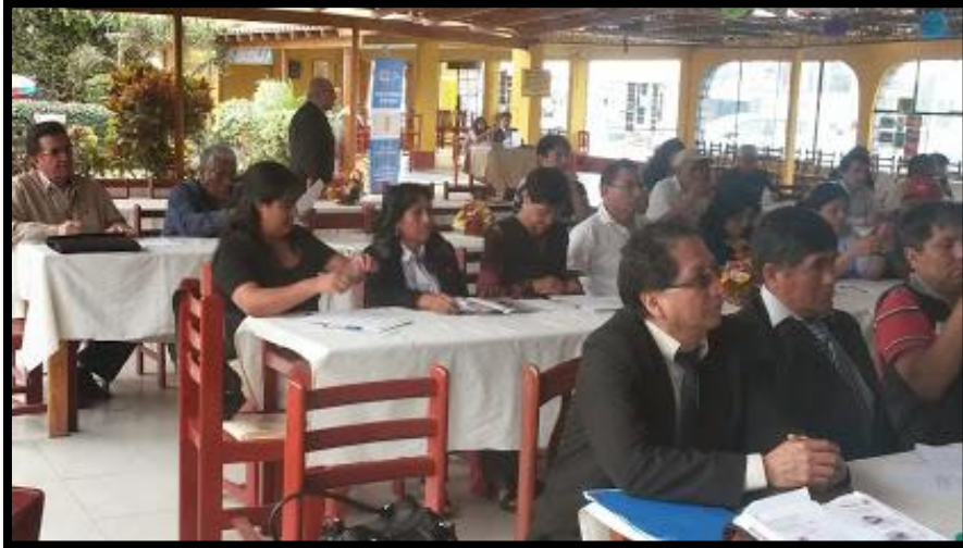
Lanzamiento del Consejo de Desarrollo Económico Territorial de Lima Sur

Lanzamiento del Consejo de Desarrollo Económico Territorial por las Limas, conformado por los grupos impulsores y actores económico (públicos y privados). Y posteriormente realizar el lanzamiento del Consejo Metropolitano de Desarrollo Económico.