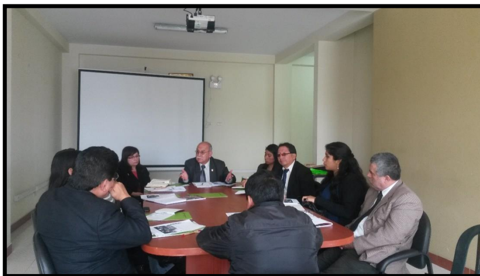
Reunión en el distrito de Lurín, planificando el Lanzamiento del CODET Lima Sur

Lo señalado, más el contexto y el marco conceptual expresados en la Ley de municipalidades, pone a la Municipalidad Metropolitana de Lima y las municipalidades distritales, en la necesidad de organizarnos adecuadamente para actuar de manera integrada por el Desarrollo Económico y Social y realizar Políticas Públicas con Cohesión Social de la Ciudad.