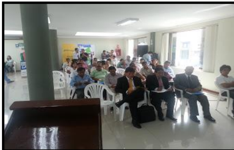
Reunión del Grupo Impulsor de Lima Sur