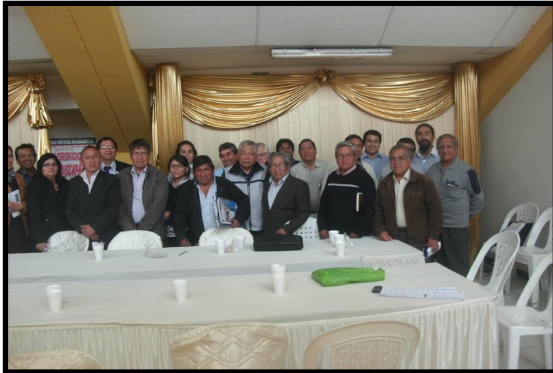
Reunión del Grupo Impulsor de Lima Norte