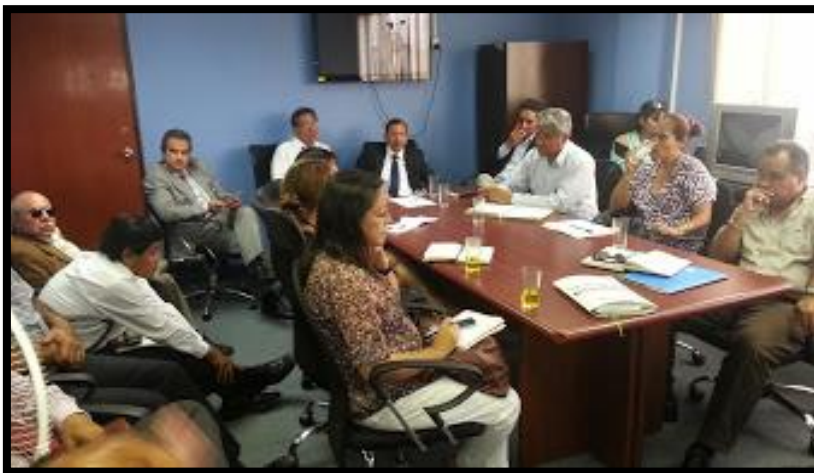
Reunión del Grupo Impulsor de Lima Este