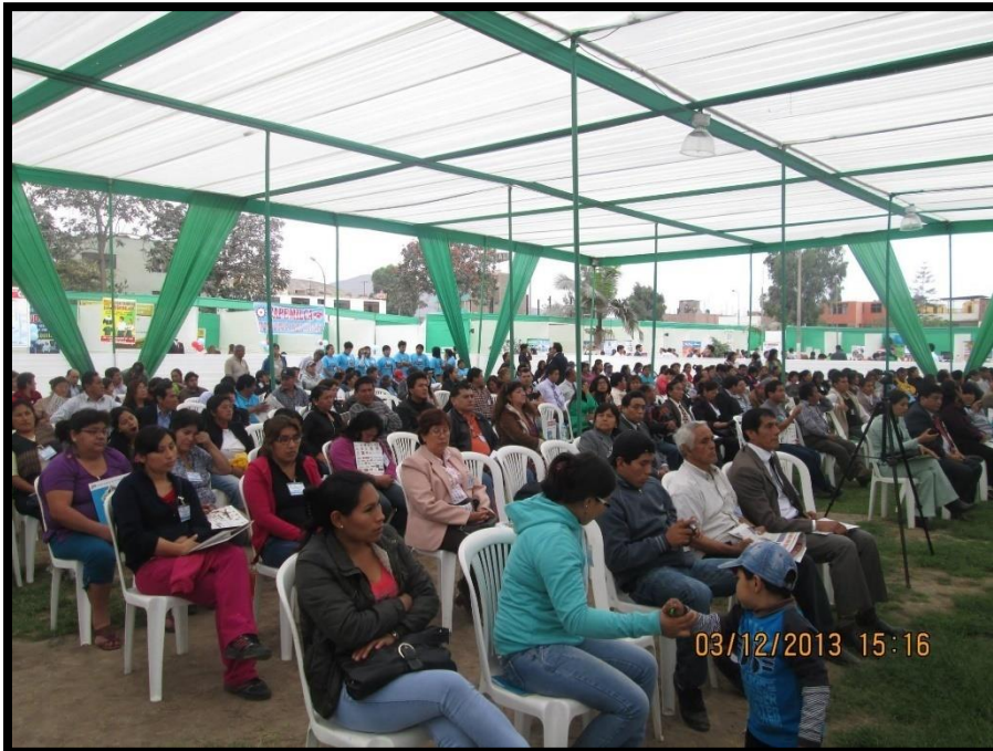
Lanzamiento del Consejo de Desarrollo Económico Territorial de Lima Norte