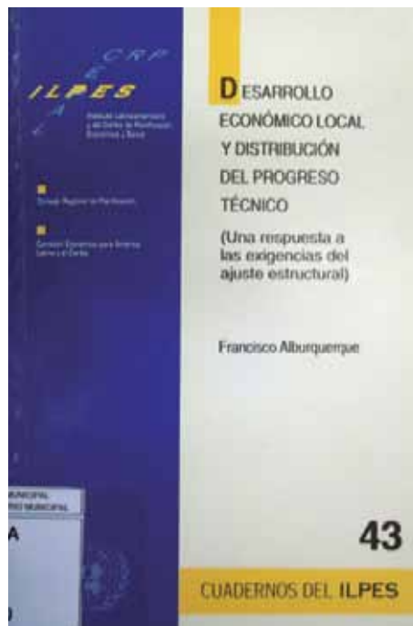
4 Figura 4 Portada del trabajo de Alburquerque publicado en Cuadernos del ILPES (1997)

Todas estas contribuciones, elaboradas en el marco de sus tareas de capacitación y asesoría técnica en las que participó en su rol como director de esta área en el ILPES, son revisadas y reunidas en una única publicación que Alburquerque prepara para los Cuadernos del ILPES en Octubre de 1997, titulada " Desarrollo económico local y distribución del progreso técnico (una respuesta a las exigencias del ajuste estructural) " (Figura 4).