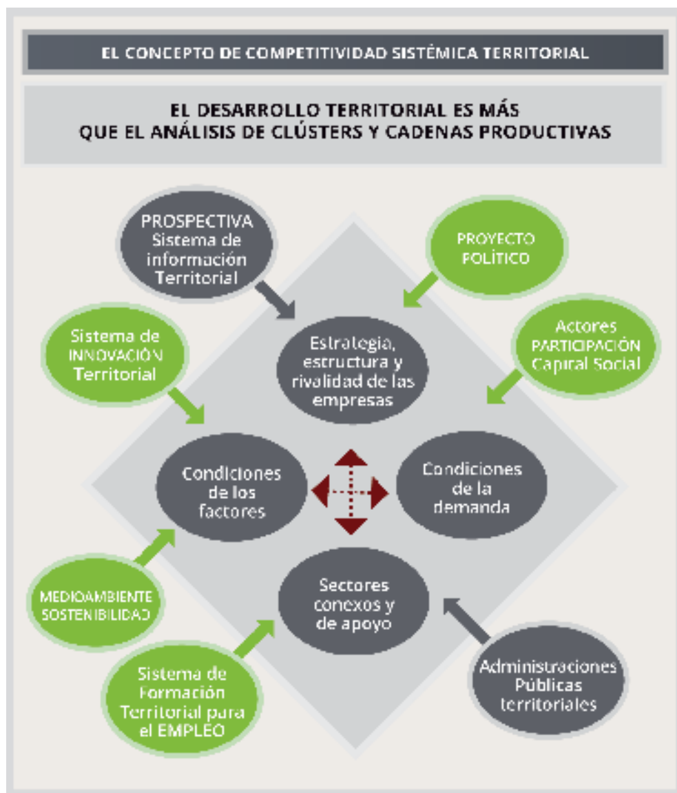
10 Figura 10 Alburquerque, (2015)

Como podemos ver también en estos últimos aportes recuperados, en el centro del pensamiento sobre el desarrollo económico local Alburquerque sitúa al territorio y los factores más intangibles ( blandos ) del desarrollo (vinculados a la dimensión cultural-institucional y al desarrollo social y humano), sin desatender la dimensión económica que caracteriza a los aportes del especialista. Ahora bien, como ya mencionamos se trata de una concepción del territorio amplia e integral, que abordará con mayor énfasis en los artículos de estos últimos tres años.