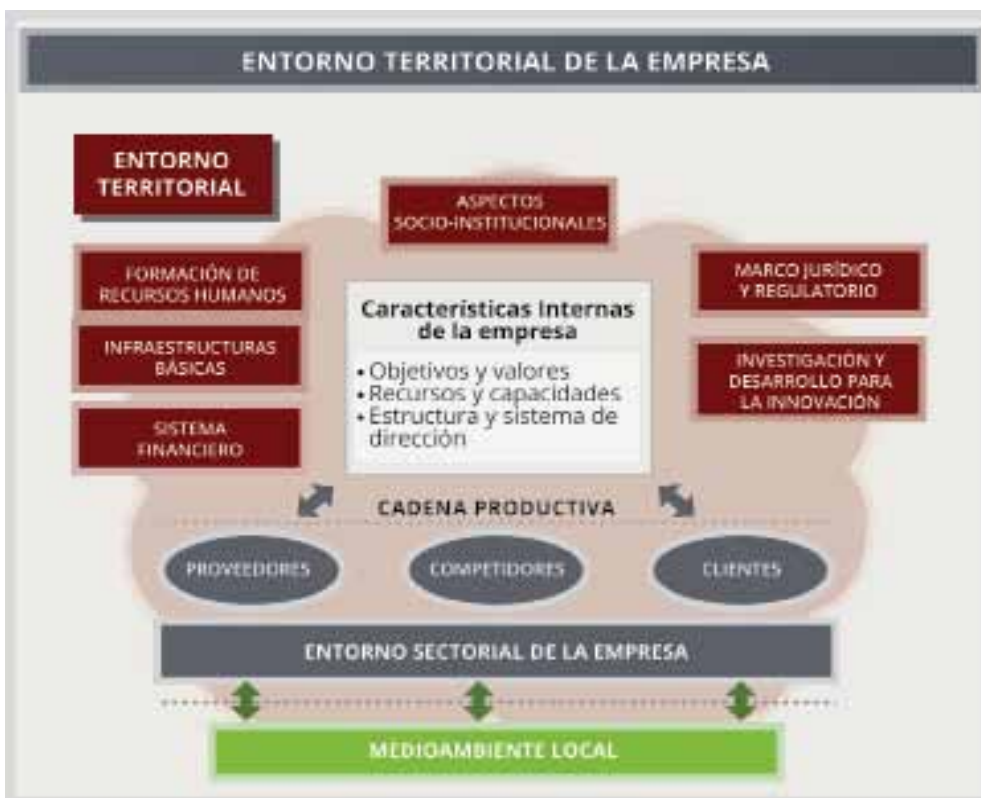
9 Figura 9 Albuquerque, (2015)

En este mismo trabajo destacan que el punto de partida de cualquier estrategia de desarrollo territorial radica en el esfuerzo de movilización y participación de los actores locales que hay que lograr impulsar en un determinado territorio para fortalecer el capital social . Ello requiere, al mismo tiempo, de actividades de fortalecimiento de los gobiernos locales, el mencionado impulso a la cooperación público-privada, la coordinación institucional de los diversos niveles, y el fomento de la cultura local emprendedora que propicien la innovación social y cultural.