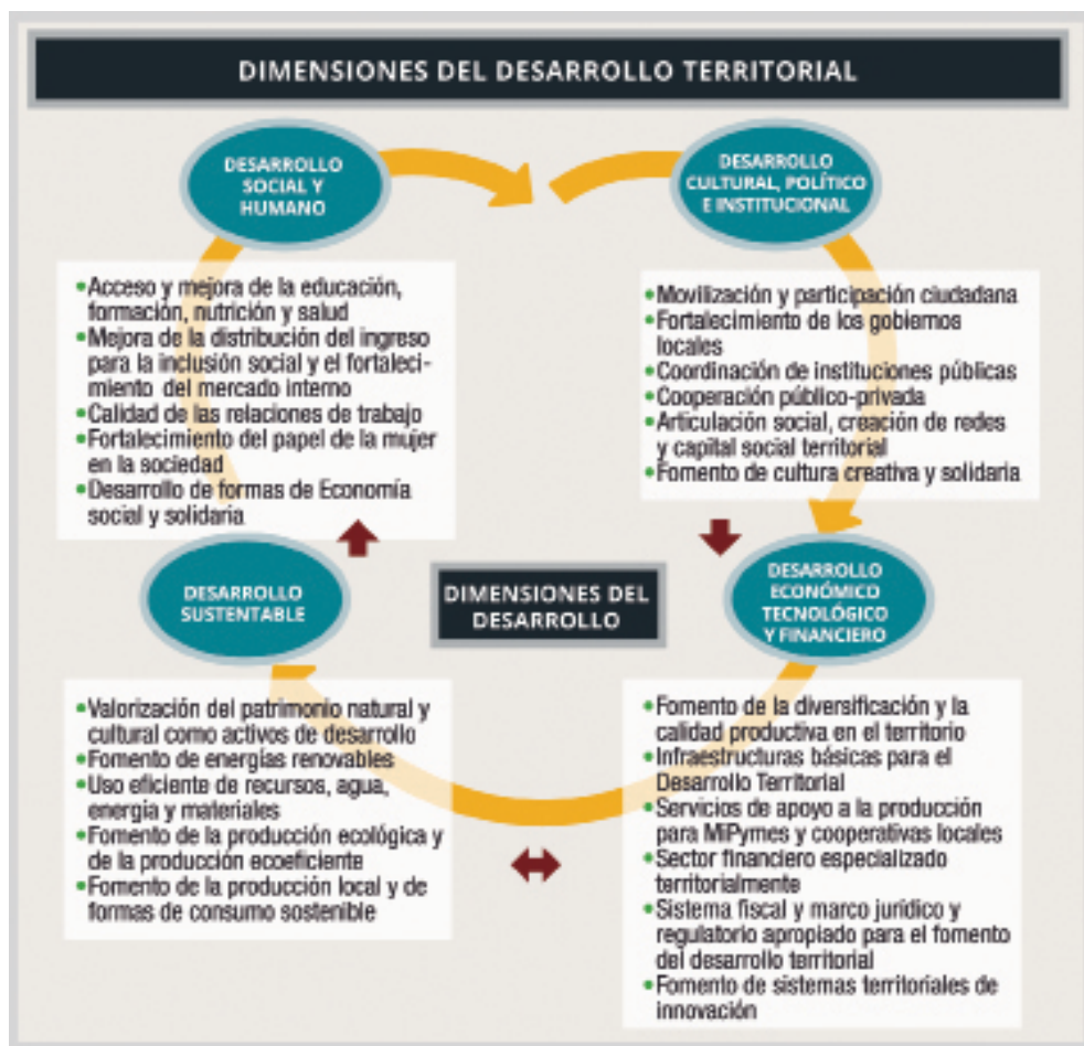
5 Figura 5 Alburquerque, (2015: 19)

Mientras que la definición de desarrollo local o territorial (términos utilizados de manera indistinta por este autor) pone el énfasis en la promoción del desarrollo “desde abajo”, impulsando la participación de los diferentes actores e incorporando la relevancia que tiene la visión integrada que permite la lógica territorial, considerando no sólo los aspectos económicos sino los sociales, institucionales y culturales (Alburquerque, Dini, 2008: módulo 0 p. 17). Es decir se trata de una visión ampliada, más integral, que pone en juego las demás dimensiones del desarrollo –lo institucional, político, cultural, humano y ambiental (ver Figura 5).