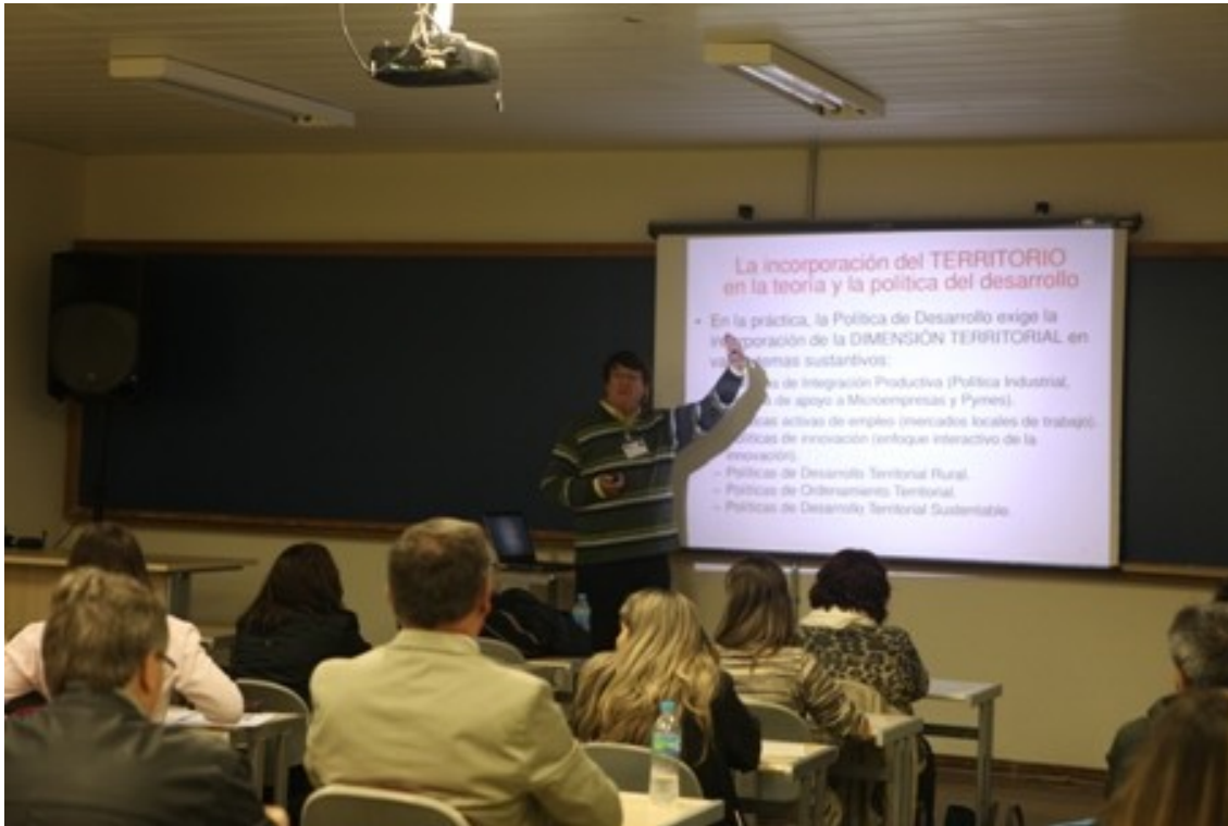
FIGURA- 7 – Aula do Professora Maria Angélica Jung