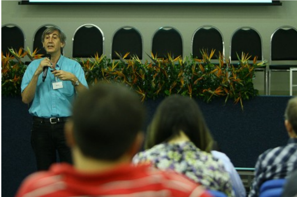
FIGURA 2 – Abertura do Curso de Formadores.