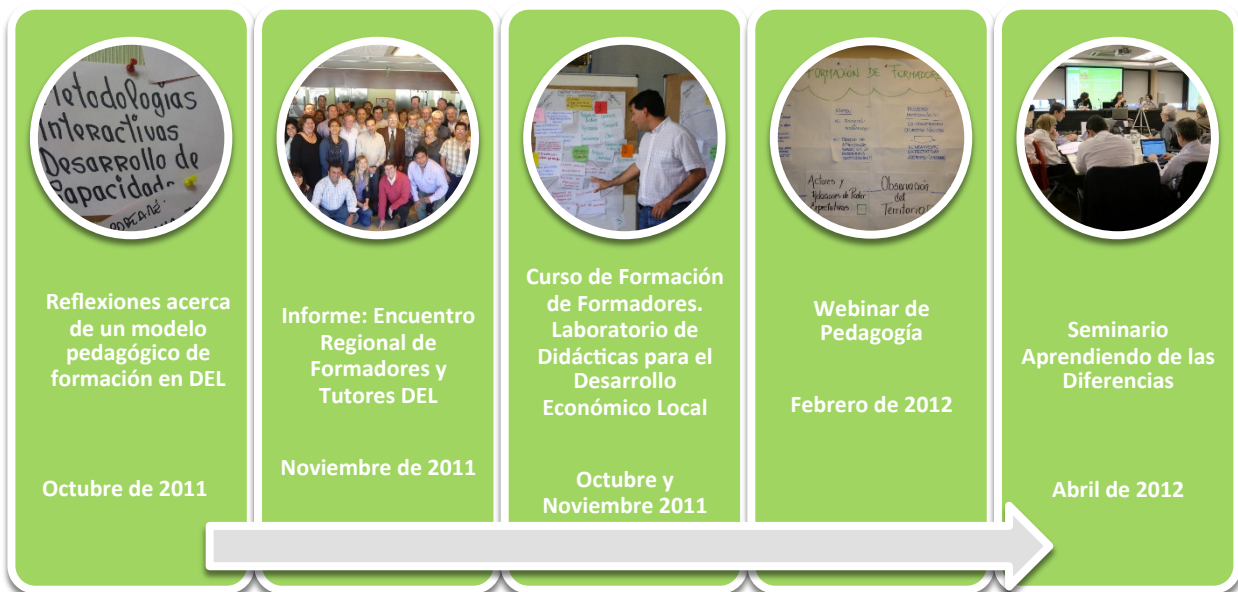
Gráfico síntesis cronológica de los Antecedentes analizados (2011 – 2013)

En relación a esta última pregunta, metodológicamente utilizaremos la expresión formador/facilitador cuando hagamos referencia a aquellos documentos en los que no se realiza una distinción explícita entre ellos, o se abordan ambos términos.