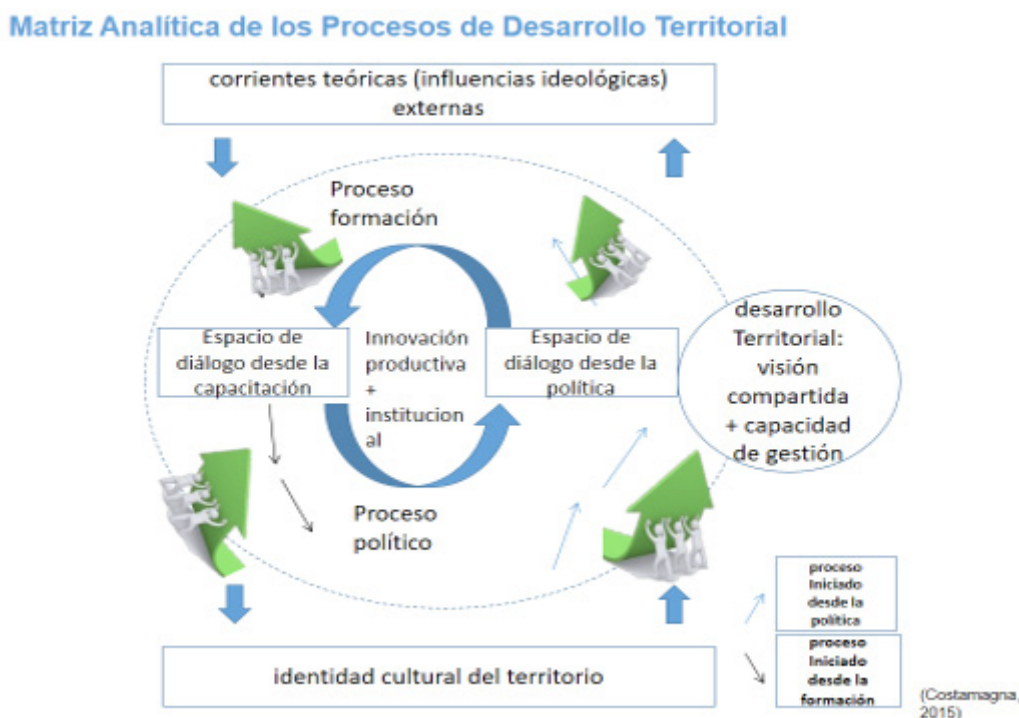
Figura 1; p. 72, Costamagna, 2015.

Estas personas facilitadoras, van mucho más allá de un facilitador de talleres participativos. Son personas que facilitan procesos sociales complejos, participan de espacios formales e informales donde no hay linealidad y sí mucha incertidumbre, diálogo y conflicto. Nuestras personas facilitadoras del Desarrollo Territorial asumen una intermediación