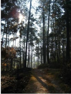
Corazón del Bosque

Elaboración de un sendero interpretativo