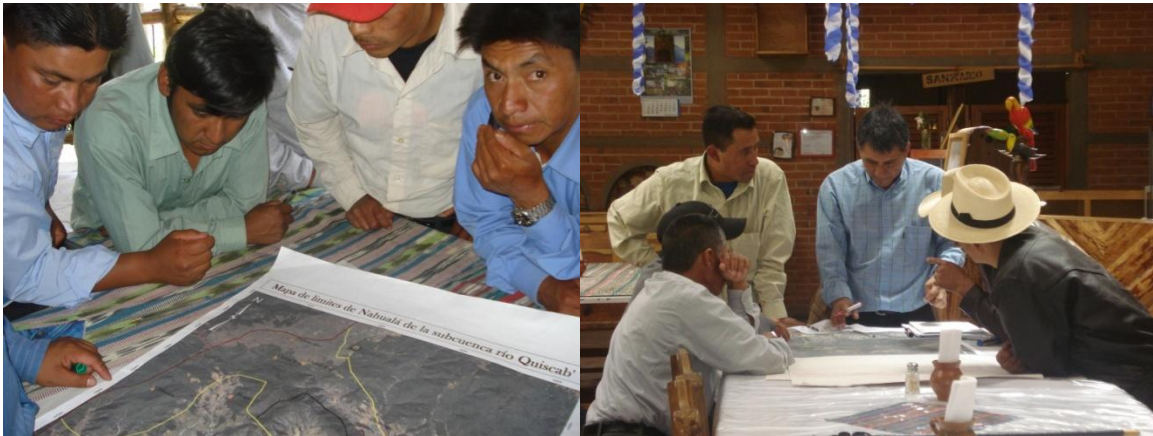
Los Sistemas Territoriales de Información aplicados a proyectos de desarrollo territorial e interacción cara a cara de actores territoriales.

Alcanzado el proceso de construcción de objetivos comunes y seleccionadas algunas de las actividades que deben realizarse, deben seleccionarse las cadenas productivas con las que iniciarán las acciones del proyecto, una herramienta útil y participativa es la matriz de impacto y factibilidad, en donde para cada una de las cadenas posibles, se establece cuál sería el impacto de fortalecer la cadena y la factibilidad de dicho fortalecimiento. En una escala de 1 a 5 en donde 1 representa nulo impacto y 5 máximo impacto se evalúa el impacto y la factibilidad.